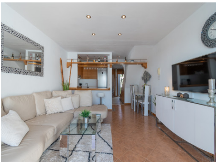
Offen gestalteter Wohn-/Essbereich