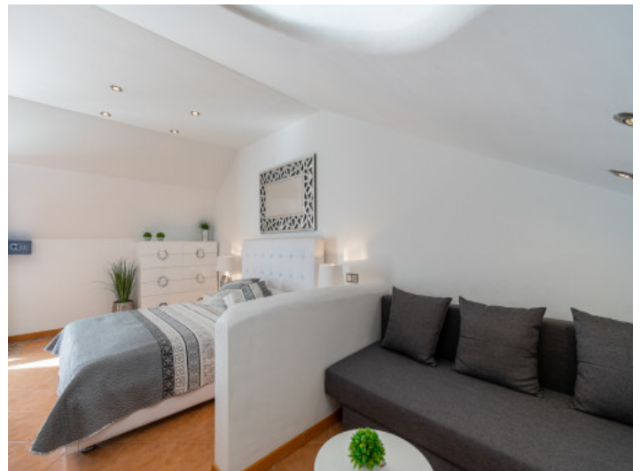
Eines von 2 Schlafzimmern