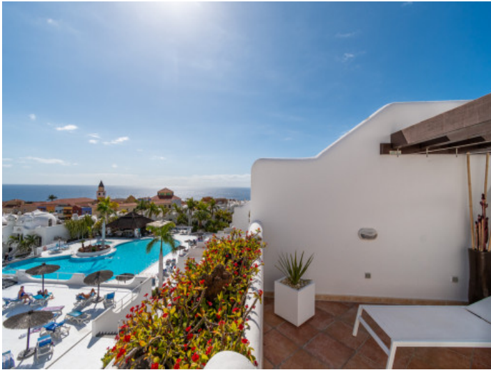
Terrasse mit Weitblick