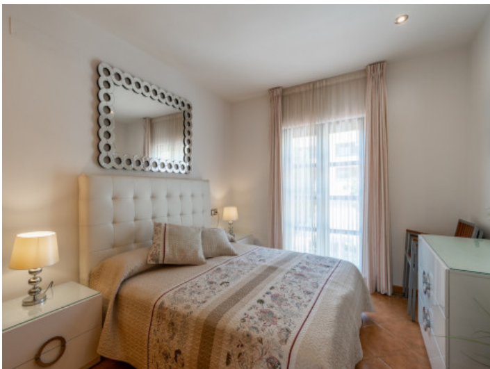
Eines von 2 Schlafzimmern