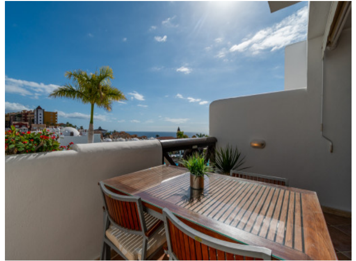
Essbereich im Freien