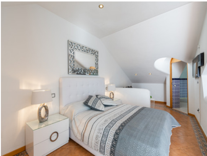
Eines von 2 Schlafzimmern