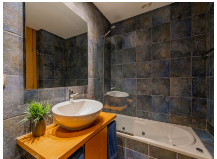
Eines von 2 Badezimmern

Alle Angaben nach bestem Wissen. Irrtum und Zwischenverkauf vorbehalten. Dieses Exposé ist eine Vorinformation, als Rechtsgrundlage gilt allein der notariell abgeschlossene Kaufvertrag.