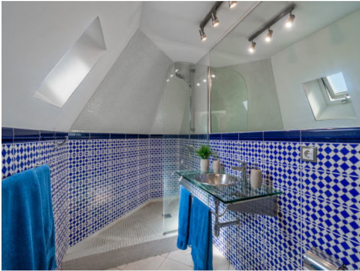
Eines von 2 Badezimmern