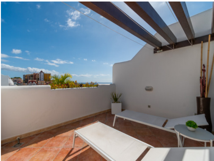
Terrasse mit Sonnenliegen