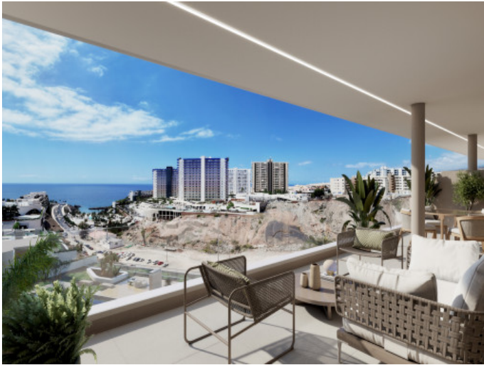
Terrasse mit Meerblick