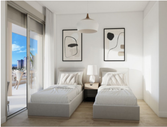
Ein weiteres Schlafzimmer