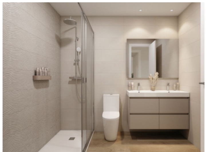
Badezimmer mit bodentiefer Dusche

Alle Angaben nach bestem Wissen. Irrtum und Zwischenverkauf vorbehalten. Dieses Exposé ist eine Vorinformation, als Rechtsgrundlage gilt allein der notariell abgeschlossene Kaufvertrag.