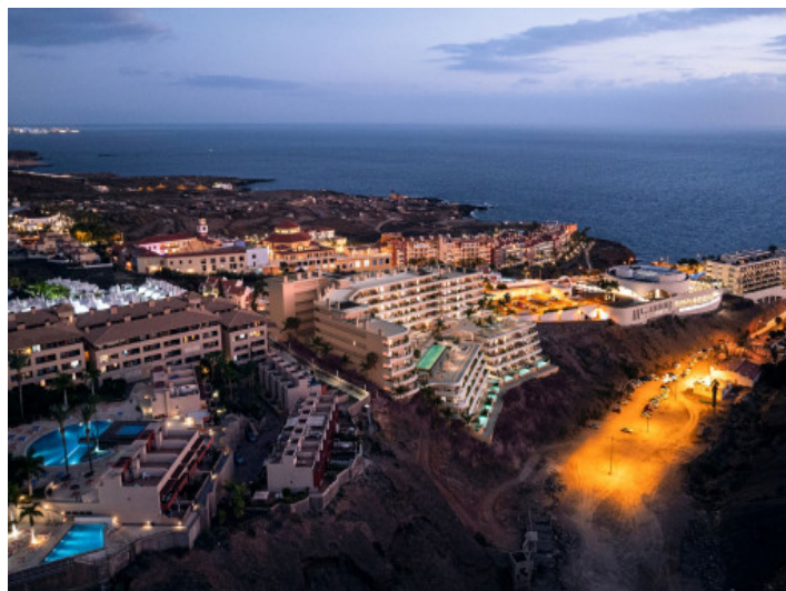
Blick auf den Atlantik