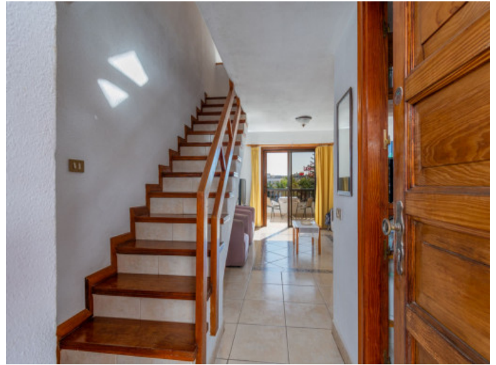
Treppe zum Schlafzimmer