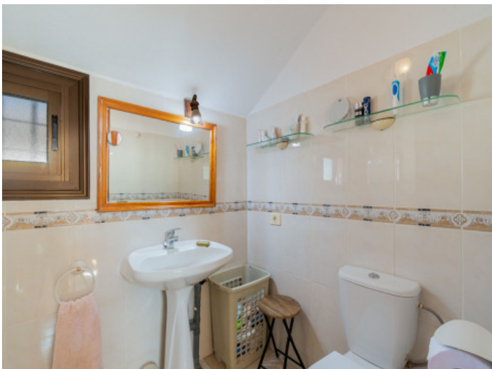
En Suite Badezimmer

Alle Angaben nach bestem Wissen. Irrtum und Zwischenverkauf vorbehalten. Dieses Exposé ist eine Vorinformation, als Rechtsgrundlage gilt allein der notariell abgeschlossene Kaufvertrag.