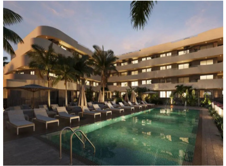
Außenansicht bei Dämmerung