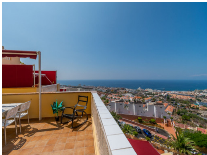
Terrasse mit Meerblick