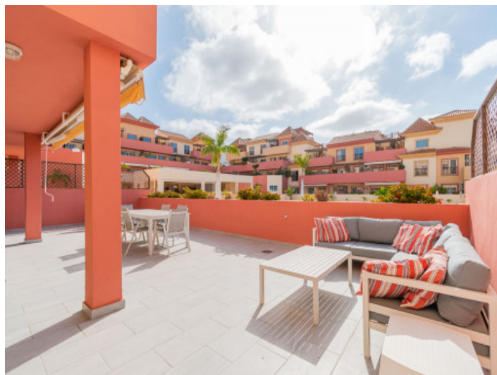
Ausblick auf den Gemeinschaftspool