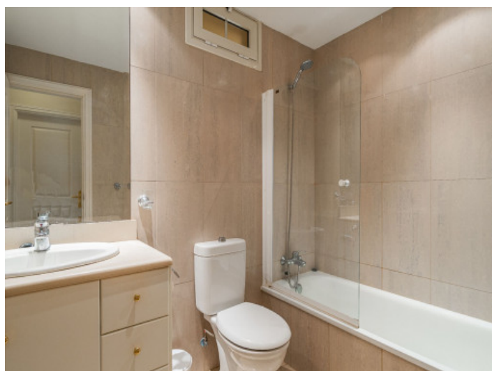
Wohnung mit 2 Badezimmern

Alle Angaben nach bestem Wissen. Irrtum und Zwischenverkauf vorbehalten. Dieses Exposé ist eine Vorinformation, als Rechtsgrundlage gilt allein der notariell abgeschlossene Kaufvertrag.