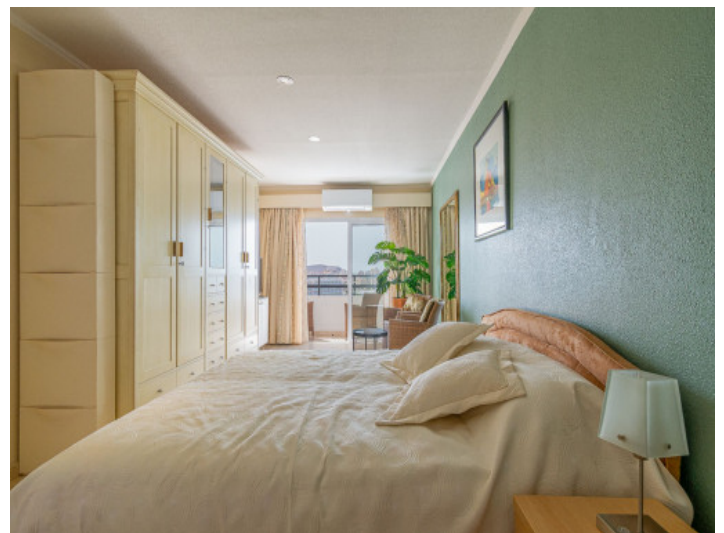
Eines von 2 Schlafzimmern