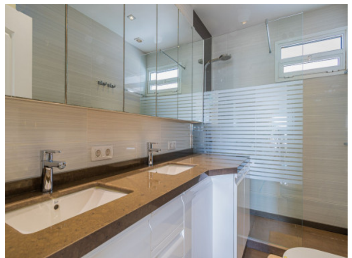
Die Wohnung bietet 2 Badezimmer

Alle Angaben nach bestem Wissen. Irrtum und Zwischenverkauf vorbehalten. Dieses Exposé ist eine Vorinformation, als Rechtsgrundlage gilt allein der notariell abgeschlossene Kaufvertrag.