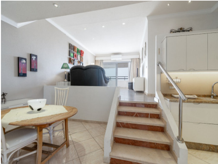
Essbereich bei der Küche