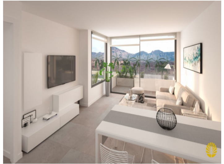
Wohn- und Essbereich