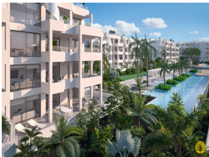
Ansicht auf die Wohnanlage