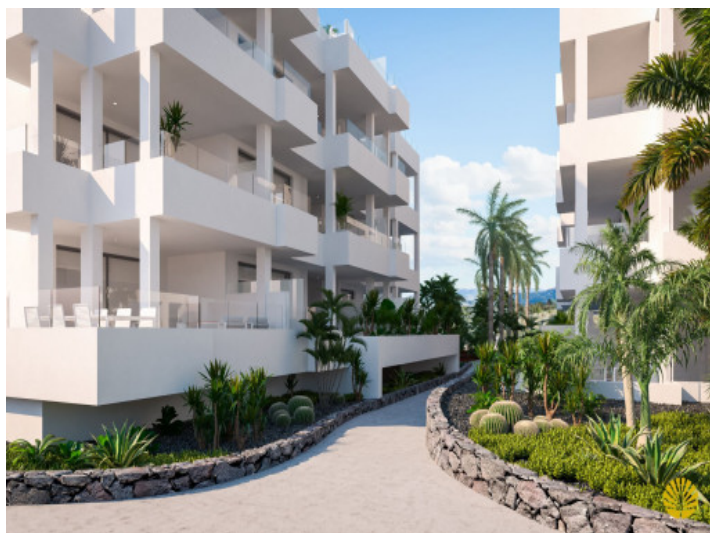
Eingang in das Gebäude