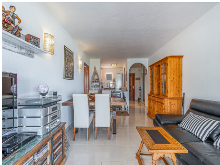
Wohn und Essbereich