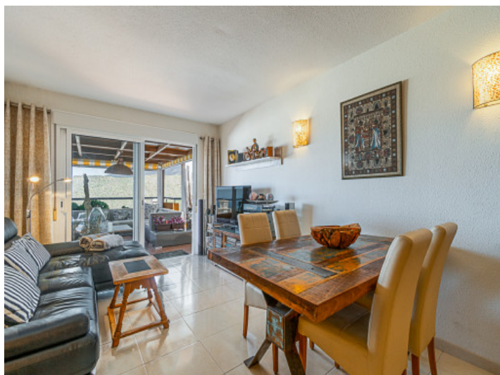
Wohn und Essbereich