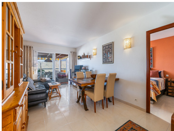
Wohn und Essbereich

Alle Angaben nach bestem Wissen. Irrtum und Zwischenverkauf vorbehalten. Dieses Exposé ist eine Vorinformation, als Rechtsgrundlage gilt allein der notariell abgeschlossene Kaufvertrag.