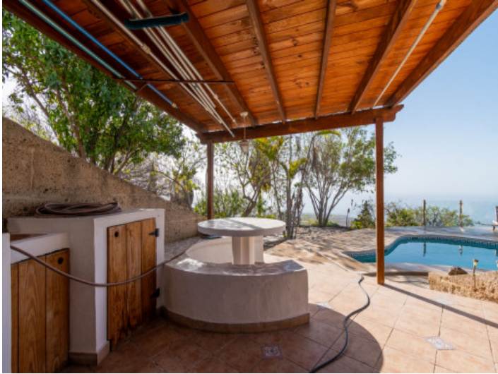
Terrasse mit Außenküche