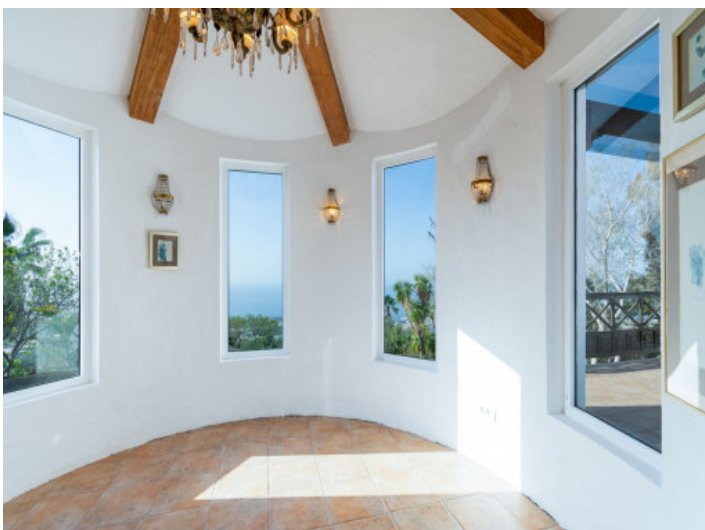
Essbereich mit Weitblick