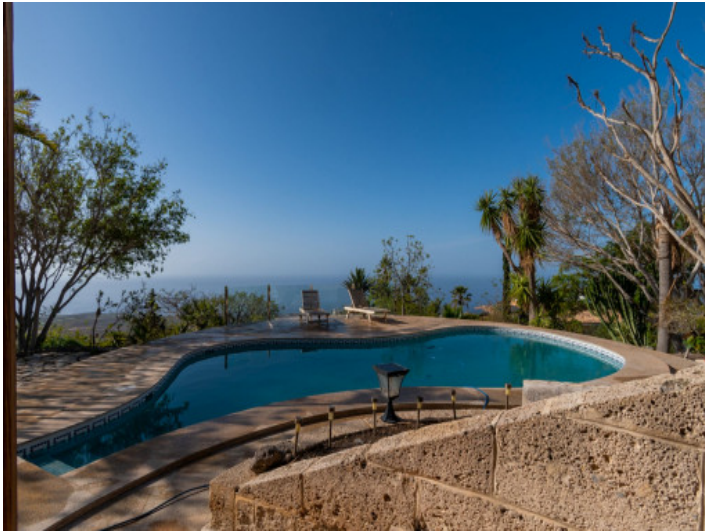
Pool und Meerblick