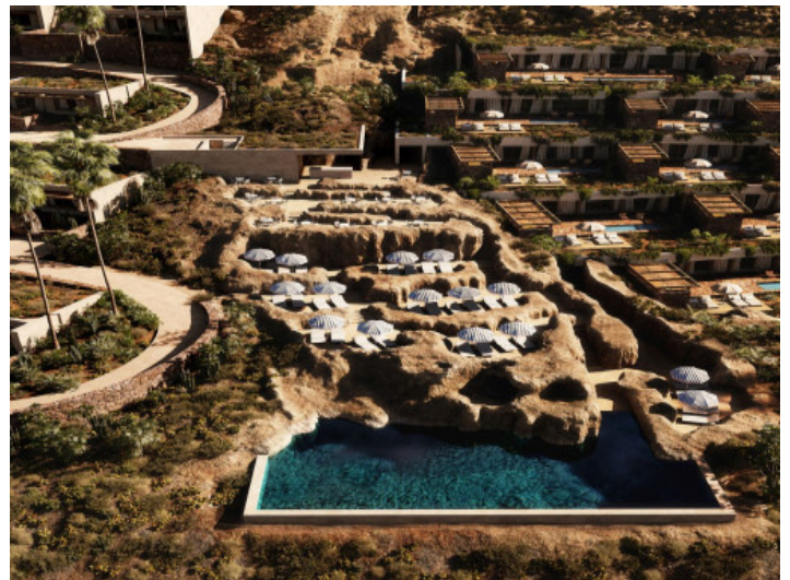
Einer von 2 Gemeinschaftspools