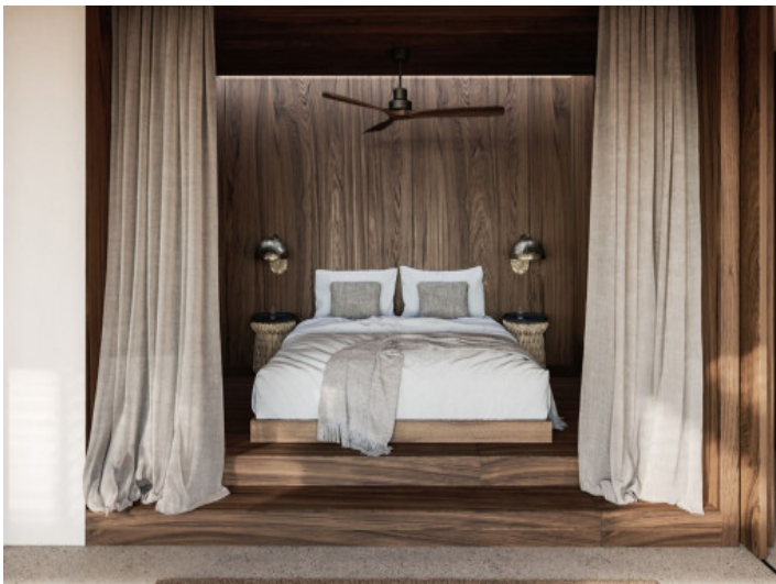
Casita mit einem Schlafzimmer