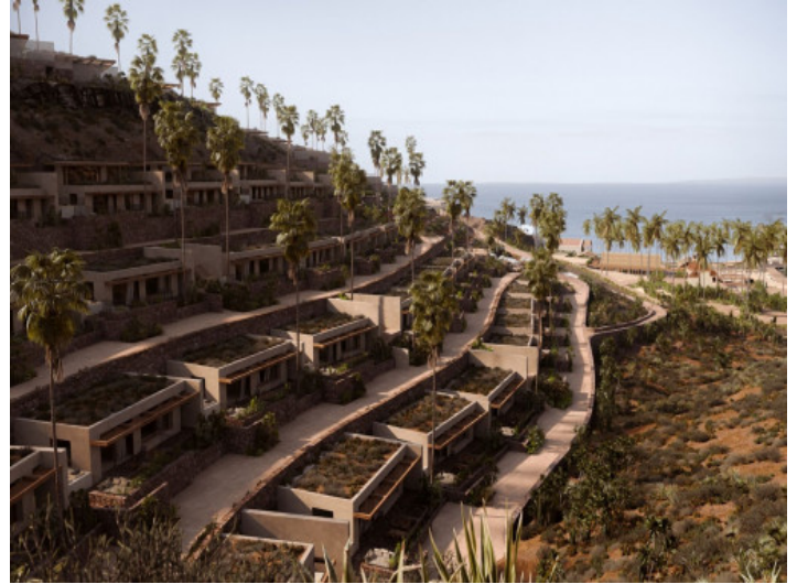
Ansicht auf den Wohnkomplex