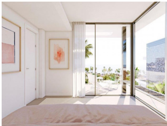
Eines von 3 Schlafzimmern