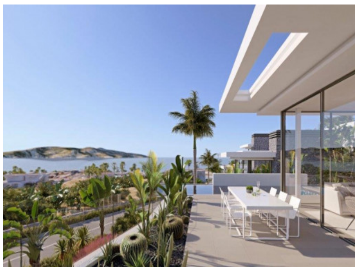
Sonnenterrasse mit Essbereich im Freien