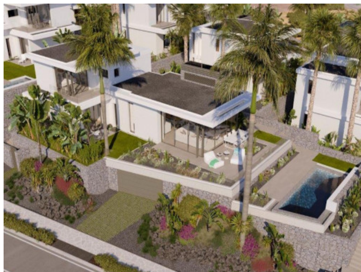
Außenansicht der Villa