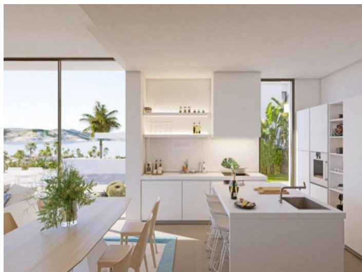
Moderne Küche mit Insel

Alle Angaben nach bestem Wissen. Irrtum und Zwischenverkauf vorbehalten. Dieses Exposé ist eine Vorinformation, als Rechtsgrundlage gilt allein der notariell abgeschlossene Kaufvertrag.