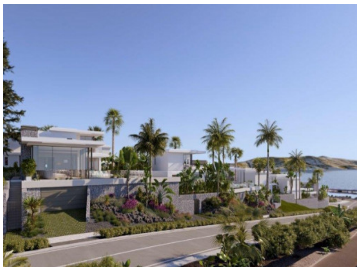
Außenansicht des Anwesens