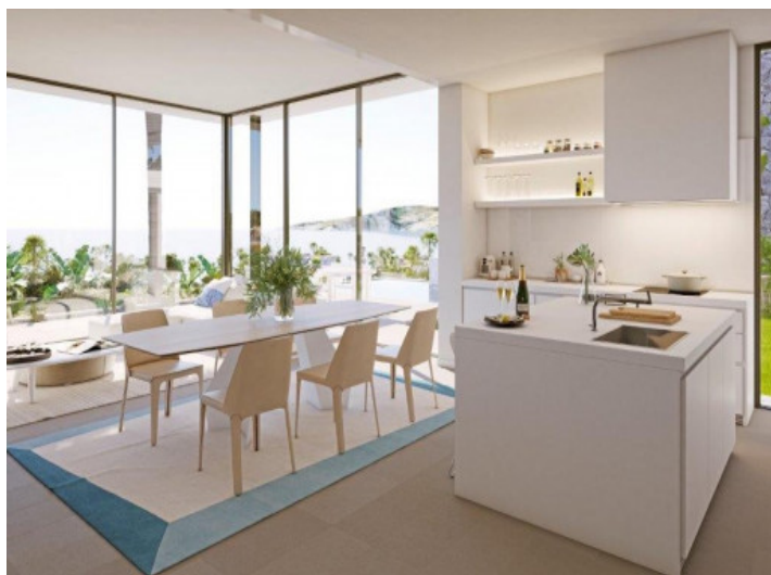
Küche und Wohnbereich