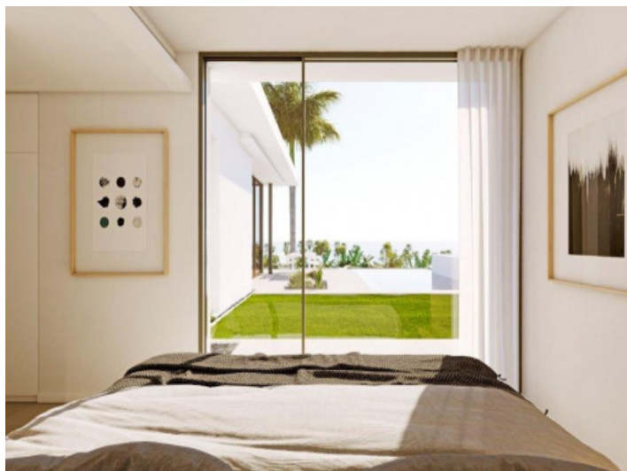
Eines von 3 Schlafzimmern