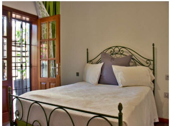
Chalet mit 3 Schlafzimmern