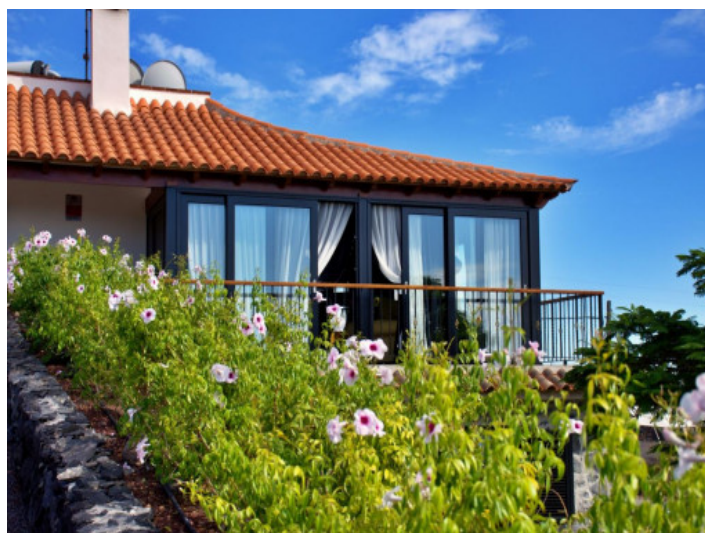
Ansicht auf das Chalet