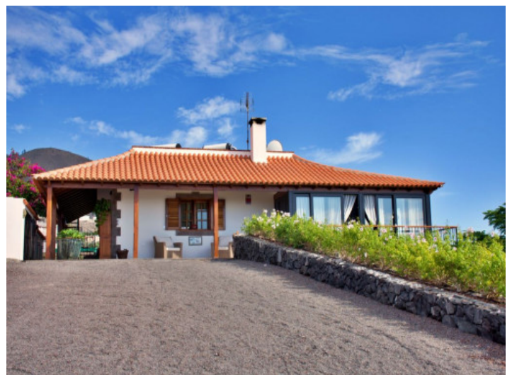
Ansicht auf das Haus

Alle Angaben nach bestem Wissen. Irrtum und Zwischenverkauf vorbehalten. Dieses Exposé ist eine Vorinformation, als Rechtsgrundlage gilt allein der notariell abgeschlossene Kaufvertrag.