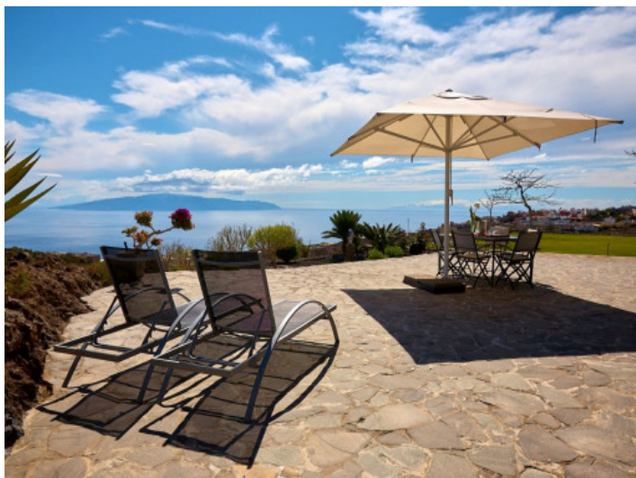
Terrasse mit Meerblick