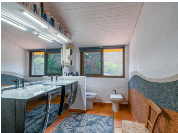
Villa mit 5 Badezimmern