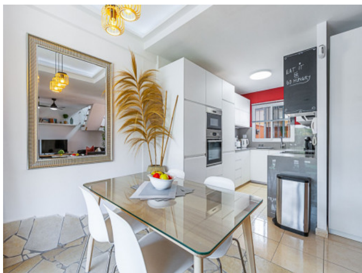
Essbereich und Küche