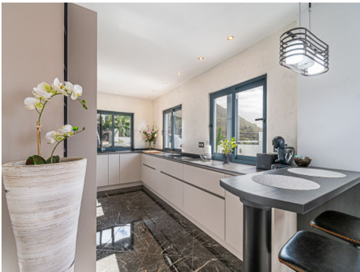
Moderne "Leicht" Küche