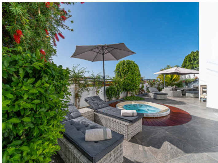
Grosse Sonnenterrasse mit Whirlpool