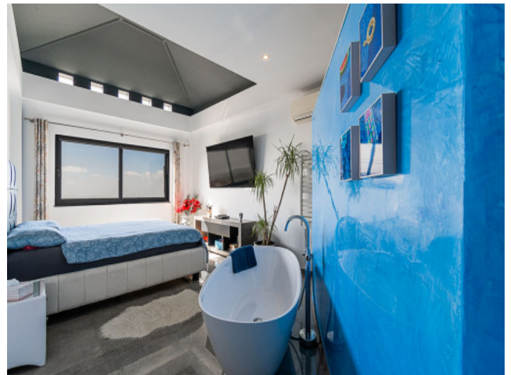
Bad en Suite