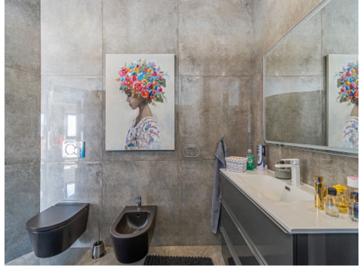
Komplett ausgestattetes Bad en Suite