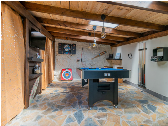
Billardzimmer im Chillout Bereich