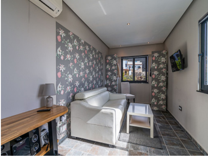
Eins von 2 Schlafzimmern