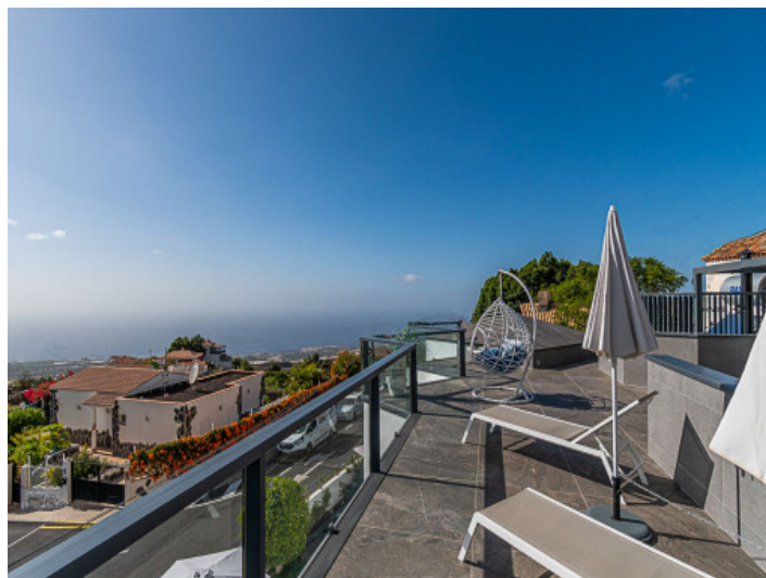
Fantastischer Meerblick und wunderschöne Sonnenuntergänge