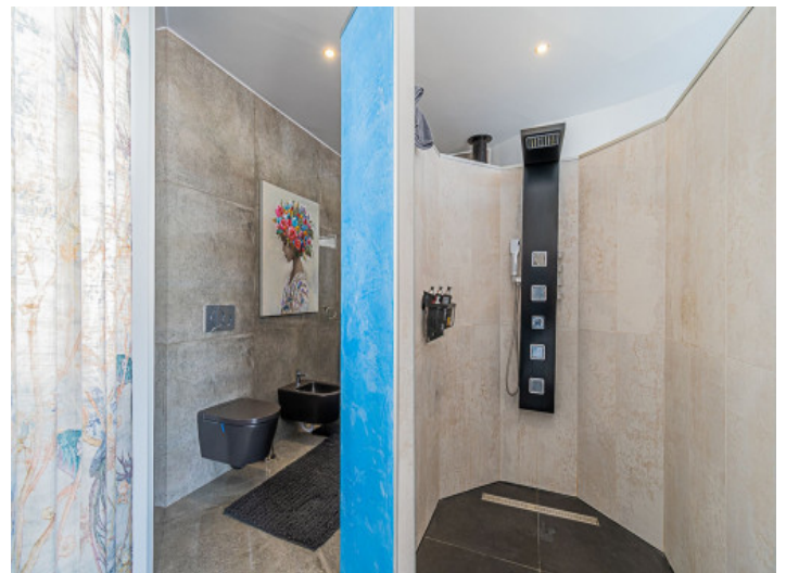
Duschbad im Bad en Suite

Alle Angaben nach bestem Wissen. Irrtum und Zwischenverkauf vorbehalten. Dieses Exposé ist eine Vorinformation, als Rechtsgrundlage gilt allein der notariell abgeschlossene Kaufvertrag.