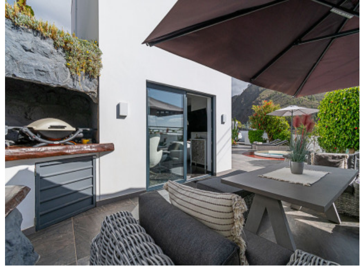
Terrasse vor dem Wohnbereich