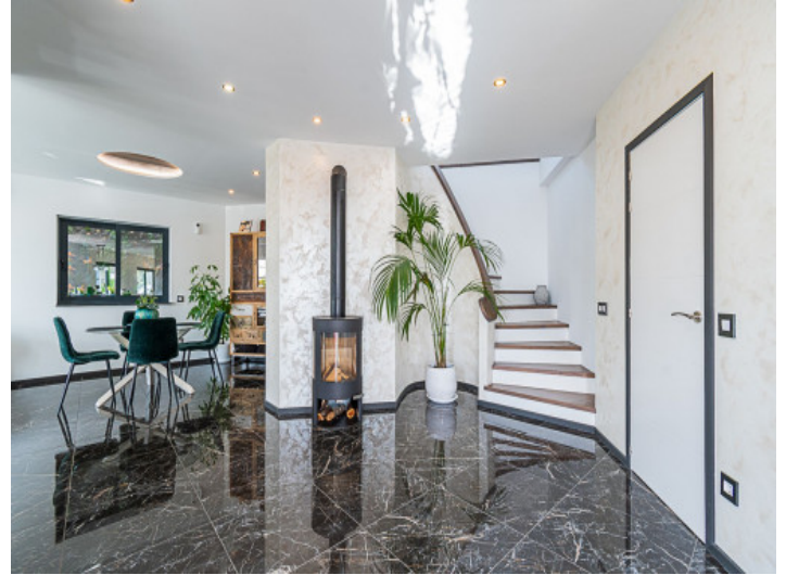
Sehr grosser und offener Wohn-/Essbereich