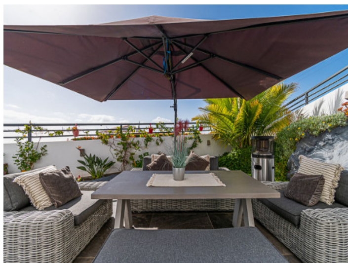
Bequeme Outdoor Lounge