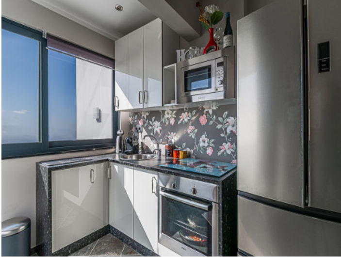
Küche im Gästeapartment