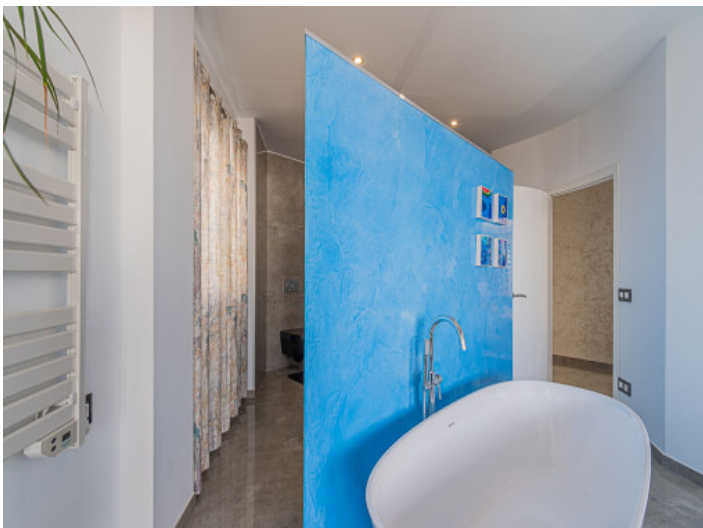
Das Bad en Suite