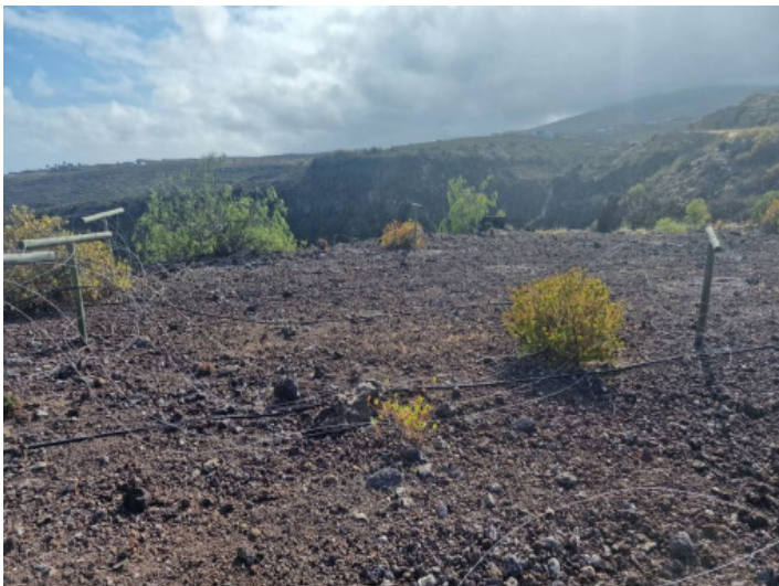
Blick in die Berge