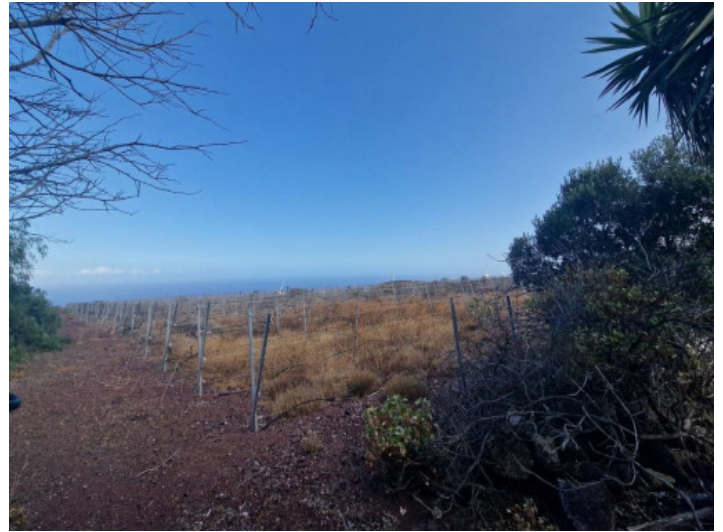
Grundstück mit viel Potential