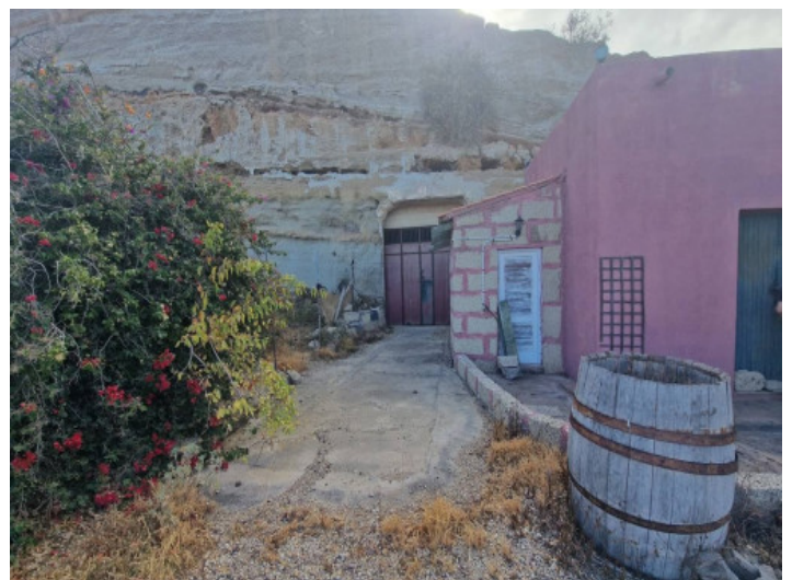
Haus auf dem Grundstück

Alle Angaben nach bestem Wissen. Irrtum und Zwischenverkauf vorbehalten. Dieses Exposé ist eine Vorinformation, als Rechtsgrundlage gilt allein der notariell abgeschlossene Kaufvertrag.