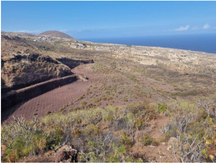
Grundstück mit Weitblick