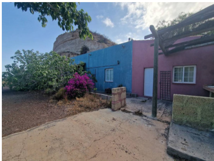
Blick auf das Haus